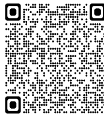
健康チェックフォームQRコード