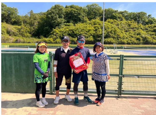
第2位:チームババリン